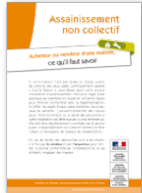
Assainissement non collectif Acheteurs ou vendeurs d'une maison, ce qu'il faut savoir 4 pages - octobre 2013