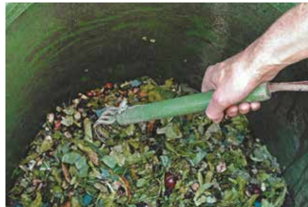
Le brassage des déchets est une des conditions de la réussite d'un compost.

réaliser un brassage régulier (notamment au début du compostage lorsque l'activité des micro-organismes est la plus forte, puis tous les 1 à 2 mois). Le brassage permet de décompacter le compost, de l'aérer et d'assurer une transformation régulière .